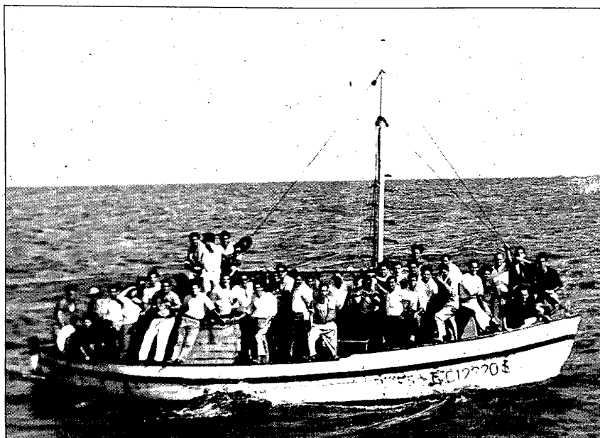
No sólo a orillas del mar se agolpan los aficionados para contemplar las regatas. También en gradas flotantes, desafiando al peligro